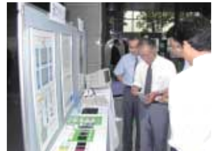
ポスターセッションの様子